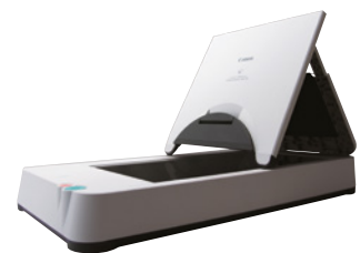
DIN A4-Flachbett-Scaneinheit 101