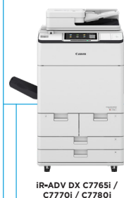
IR-ADV DX C7765i / C7770i / C7780i